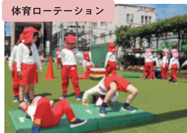
体育ローテーション

バス送迎の園児は中バス・ワンワンバス・ミニワンバスの3台で、お歩きの園児は家族の方と一緒に登園します。「おはようございます。いってきます。」元気な声が、幼稚園に響きます。